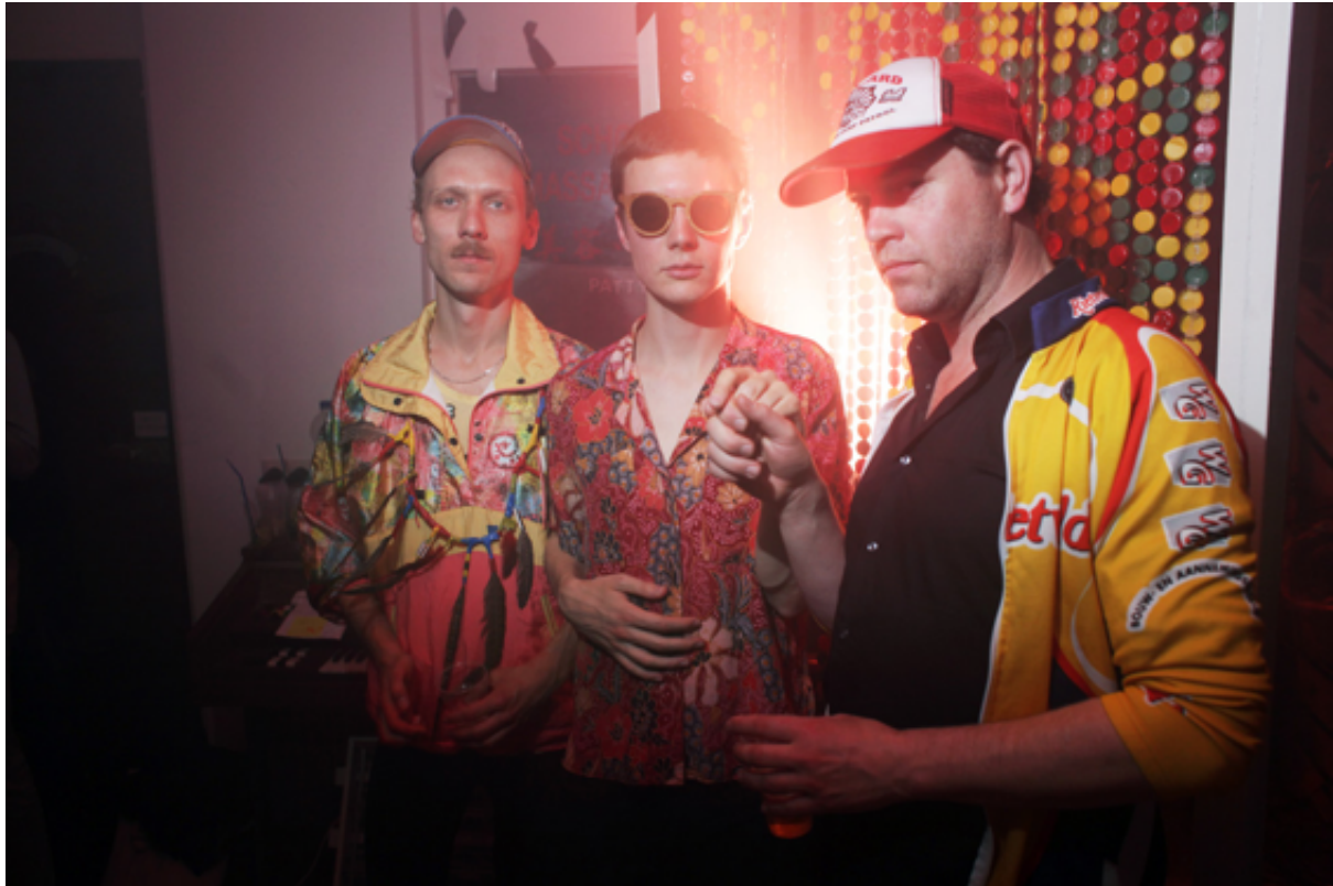
© Jan Dirk van der Burg